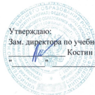
График ОргСРС по кафедре "ВТПЭ" на 2 семестр 2023 - 2024 учебного года