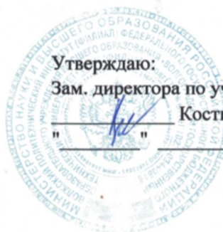
График ОргСРС по кафедре "ВХТО" на 2 семестр 2023 - 2024 учебного года